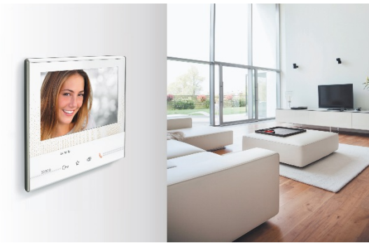
Videoportero Classe 300X13E