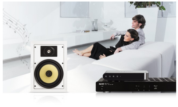
Sistema de sonido NUVO