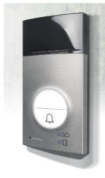
Placa Línea 3000